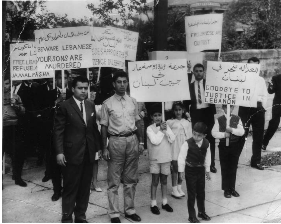
اعتراض نظمه التنظيم السري أثر صدور الأحكام بحق الأسرى القوميين وزيارة موريس غارسون في أواخر 1963